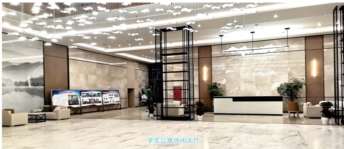
学生公寓休闲大厅